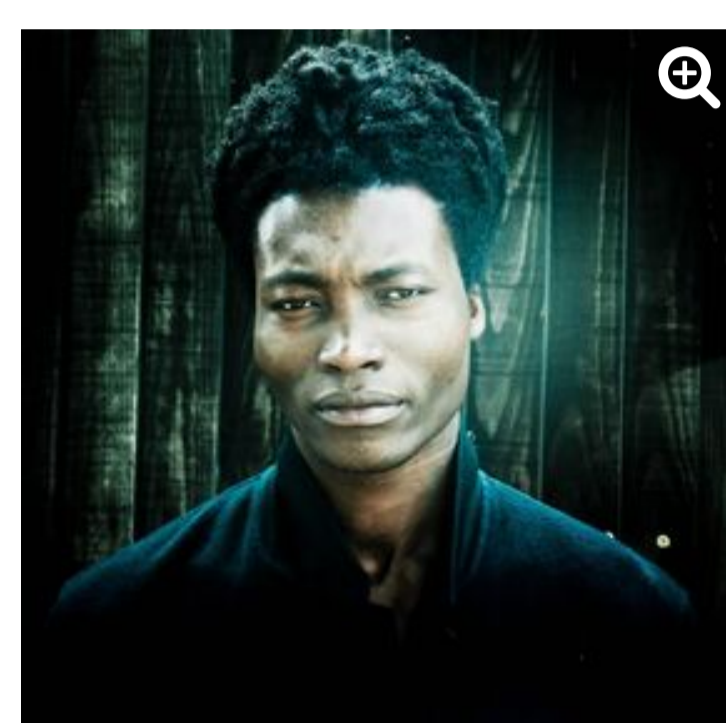
Benjamin Clementine ist einer der neuen bestätigten Acts.