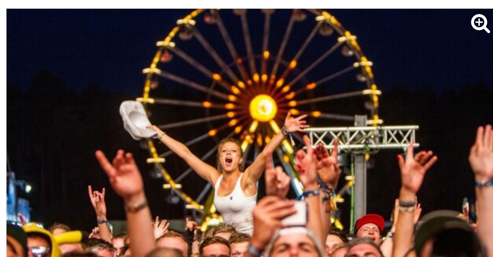
Das Programm für das Hurricane-Festival ist komplett. (Pascal Faltermann)

Benjamin Clementine, Emil Bulls, Massendefekt oder Liedfett lauten ein paar der neuen Namen für das Hurricane-Festival in Scheeßel. Die Veranstalter von FKP Scorpio gaben am Dienstagnachmittag eine neue Bandwelle für das Open-Air auf dem Eichenring in Scheeßel bekannt. Damit ist das Programm der Zwillingsfestivals Hurricane und Southside vom 22. bis 24. Juni in Scheeßel und Neuhausen ob Eck komplett, heißt es in einer Pressemitteilung.